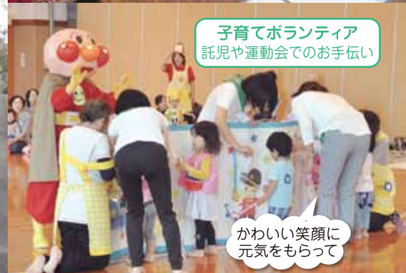
子育てボランティア 託児や運動会でのお手伝い