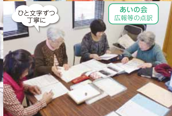
ひと文字ずつ丁寧に