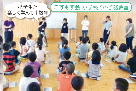
小学生と楽しく学んで十数年