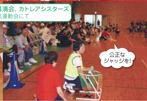
公正なジャッジを!