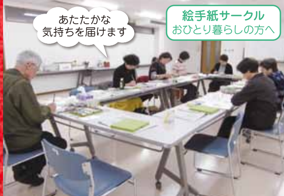
あたたかな気持ちを届けます