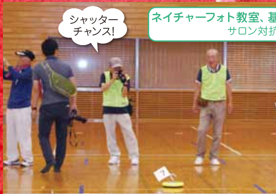
シャッターチャンス!

町内のボランティアの方々が色々な場面で楽しく活動されています。養成講座も計画しておりますので、この機会にボランティアを始めてみませんか?