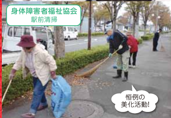
身体障害者福祉協会 駅前清掃