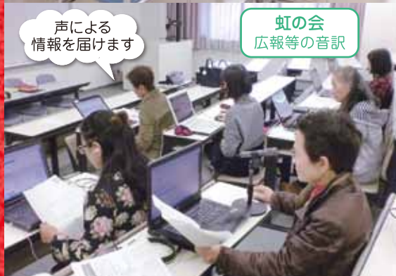
声による情報を届けます